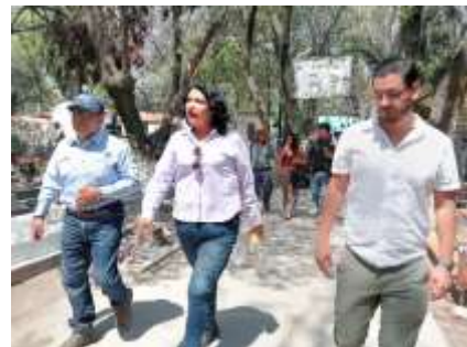
Panteón Santa Cruz Acayucan