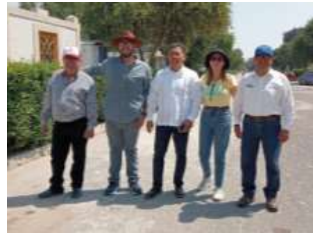
Panteón Santa Lucia