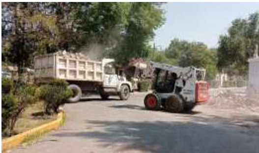
Panteón San Isidro

El propósito de estos recorridos fue evaluar el estado en el que se encuentran los panteones y analizar las acciones implementadas por el Gobierno local, con el fin de garantizar su adecuado mantenimiento y funcionamiento.